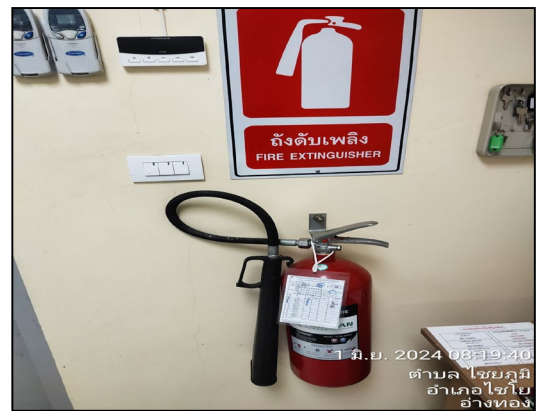
ถังดับเพลิง

ภาพที่ 3.2-4 ภาพถ่ายระบบรักษาความปลอดภัยบริเวณสถานีก๊าซฯ โครงการท่อส่งก๊าซธรรมชาติเข้าสู่โครงการผลิตไอน้ำและไฟฟ้าขนาดเล็ก บริษัท สยามเพียวไรซ์ จำกัด (ปัจจุบันเปลี่ยนชื่อเป็น บริษัท พี. กริม เพาเวอร์ (อ่างทอง) 1 จำกัด)