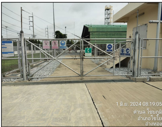
ป้ายเตือนความปลอดภัย