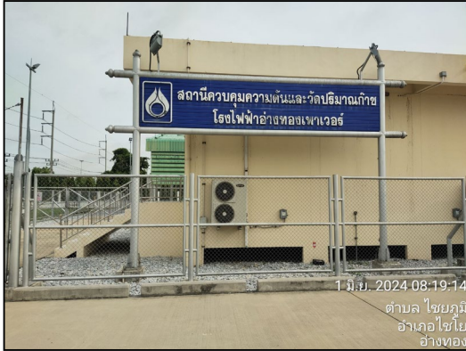
สถานีควบคุมความดันวัดและปริมาณก๊าซโรงไฟฟ้า อ่าวทองเพาเวอร์