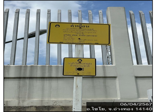
ป้ายเตือนแนวท่อส่งก๊าซธรรมชาติ